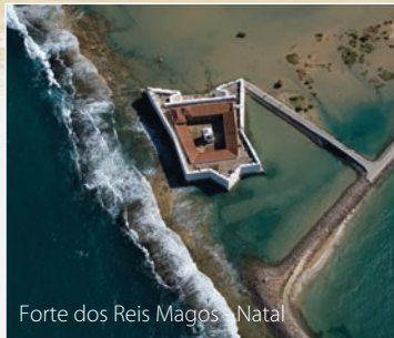
Forte dos Reis Magos - Natal