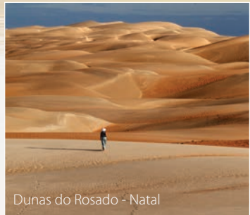
Dunas do Rosado - Natal