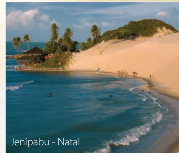
Jenipabu - Natal