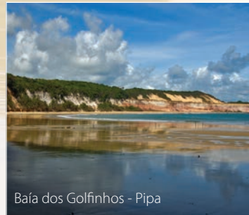
Baía dos Golfinhos - Pipa